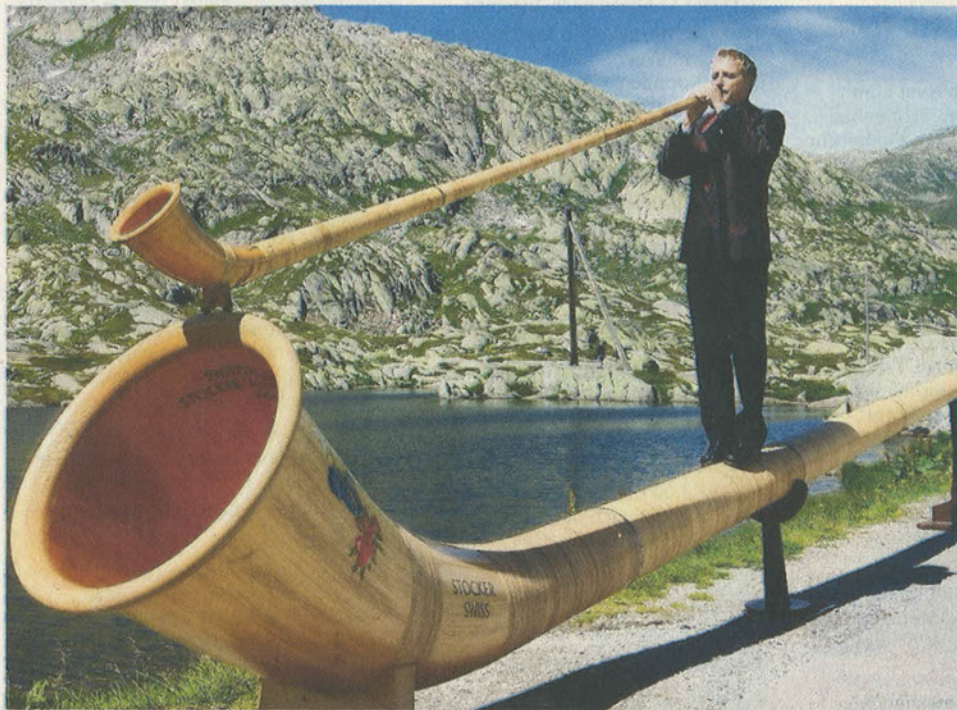
Das «Superhorn» und zum Vergleich ein «normales» Alphorn. (Bild zvg.)

Vom Dienstag, 16. Juli, bis zum Samstag, 27. Juli, können Besucher des Ein-